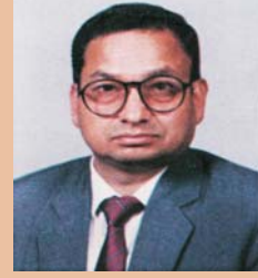
भगत विष्ट अध्यक्ष